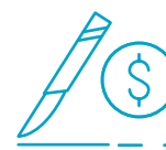
住院及門診 外科手術費用